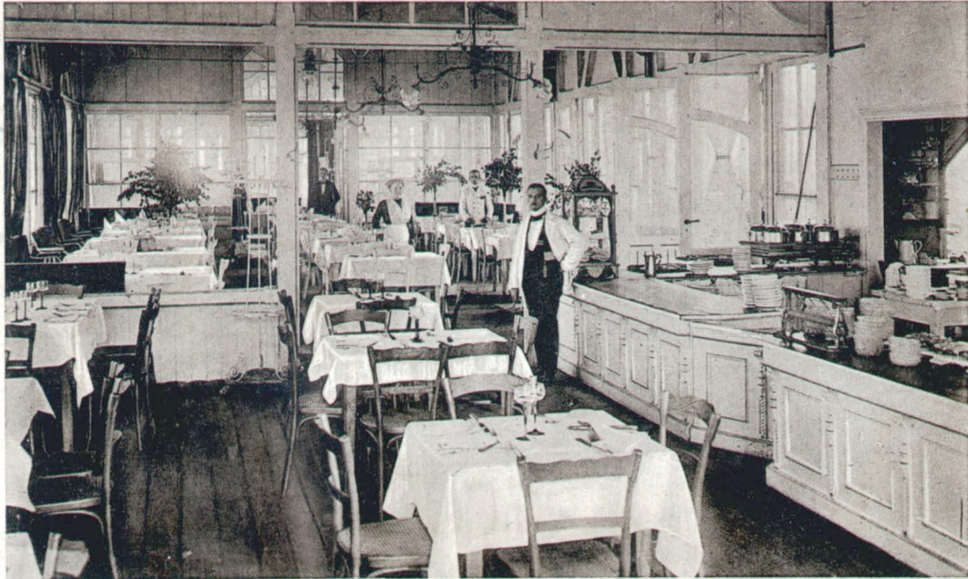
Ostseebad Rauschen (Samland) — Kurhaus Der weiße Saal