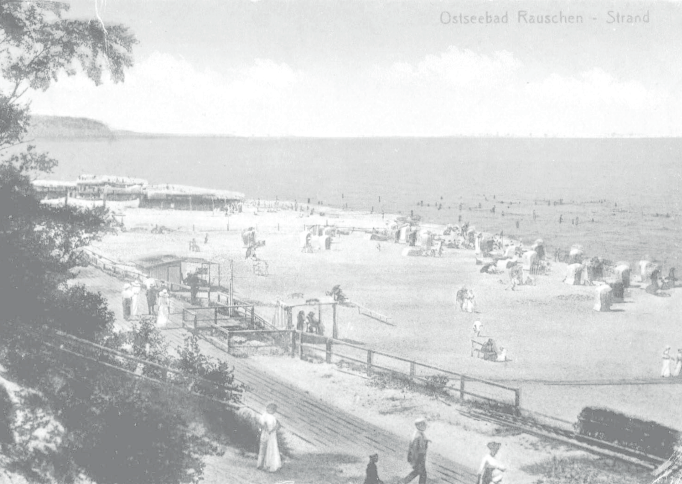
Ostseebad Rauschen - Strand